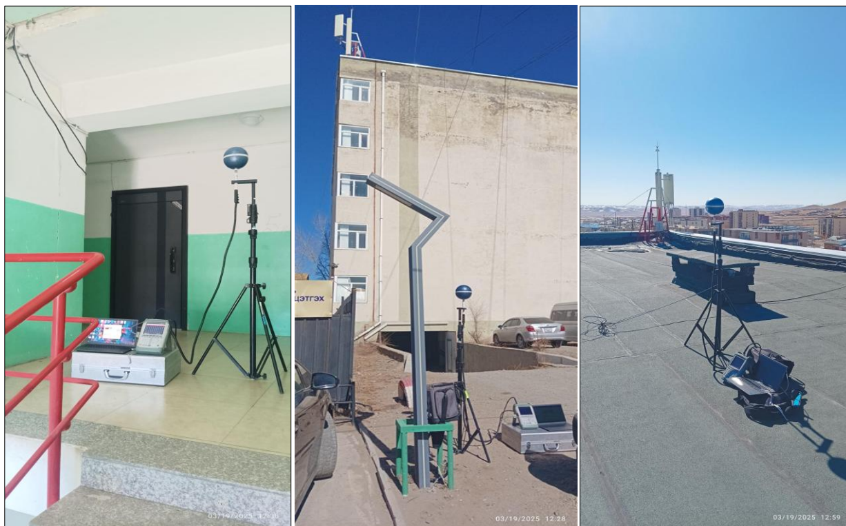
Зураг 2. Төв аймаг, Зуунмод сум, Номт баг, 24-р байрны орчимд хэмжилт хийх үеийн зураг.