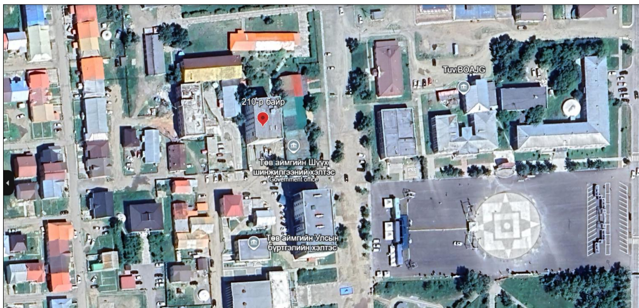
Зураг 1. Хэмжилт хийсэн 24-р байрны байршил.