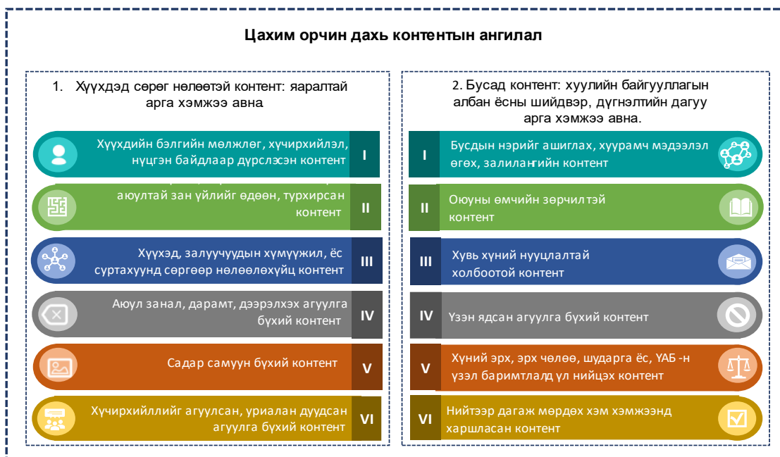
Зураг 1: Хууль бус контентын ангилал